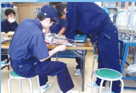
ネオジム磁石を利用した波力発電 平成30年度パテントコンテストで優秀賞 特許も取得することができました。