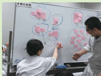
BS法・KJ法による ミーティング