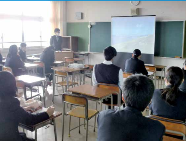
総合的な探究の時間 授業のひとコマ 男鹿の地形についての講義を受講しました。

総合的な探究の時間では、本校独自の設定による「男鹿学」を実施し、男鹿の郷土自然を中心とした郷土学習を進めています。