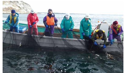
ハタハタ定置網実習