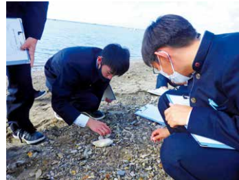
鵜ノ崎海岸での調査活動

講話を通じて男鹿学の意義や目的について考えます。各自の探究テーマを設定し調べ学習を進展させ、その成果を発表することで生徒同士が互いに郷土について学び合います。