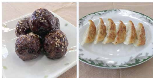
ミートボール風ハタハタ団子と ハタハタ餃子の試作品