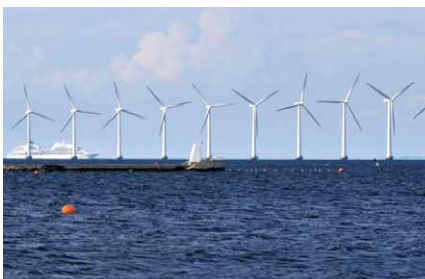
洋上風力発電のある風景