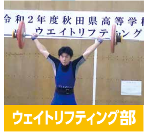
ウェイトリフティング部