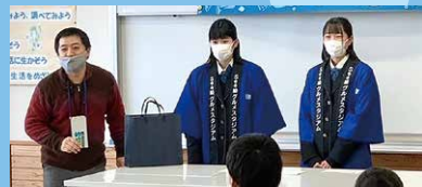
完成披露会(小学校にて)