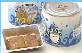
イワSeaカレーかまぼこ缶詰 (小学生のアイデアを缶詰として製品化)