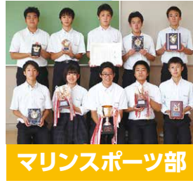
マリンスポーツ部