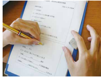
男鹿学講話と学習会

講話を通じて男鹿学の意義や目的について考えます。各自の探究テーマを設定し調べ学習を進展させ、その成果を発表することで生徒同士が互いに郷土について学び合います。