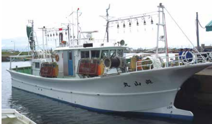
小型実習船「真山丸」