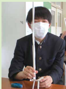
紙タワー制作の様子

食品科学科では、食品の製造方法、保存方法、流通、衛生管理を中心に学習します。実習では、サバ缶詰などの水産物の缶詰製品、蒲鉾などの練り製品を製造し、販売まで行います。また、授業や様々な実習を通して、一人ひとりがものづくりへの関心を高め、海洋資源を有効活用できる自立型人材の育成を目指します。3年次になると1カ月間、実際に企業に出向き、校内での学習以外の専門的知識と技術の習得を目的に実践的な学習を行います。