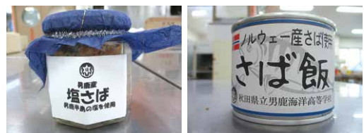
さばの新しい食べ方を考案